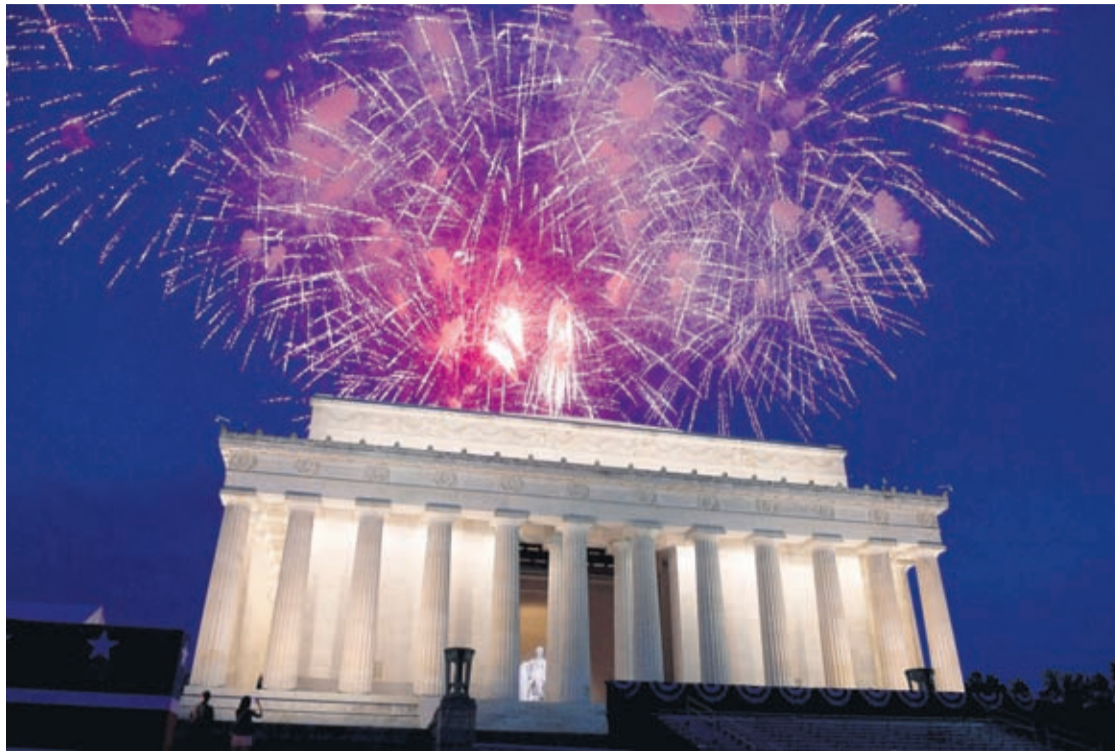
In this July 4, 2019 file photo, fireworks go off over the Lincoln Memorial in Washington, Thursday, July 4, 2019.

In New York, the Macy's annual summer spectacle was replaced by a series of smaller, surprise shows. They've been ringing out all week, leading into the tele-